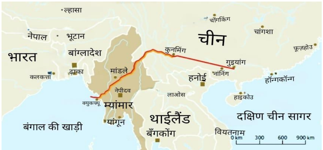
चित्र:1- म्यांमार-चीन पाइपलाइन

(चित्र-1 में दर्शायी गयी लाल रंग की पाइपलाइन बंगाल की खाड़ी से लेकर गुइयांग तक है तथा पिले रंग की पाइपलाइन क्वाउकफ्यू से लेकर कुनमिंग तक है)